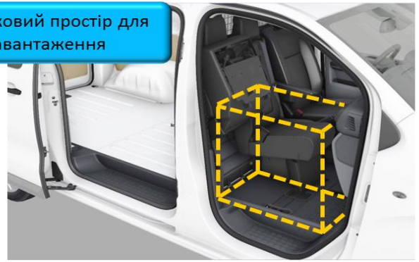
Додатковий простір для завантаження