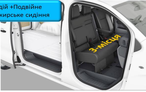
Водій +Подвійне Пасажирське сидіння