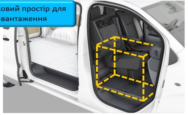
Додатковий простір для завантаження